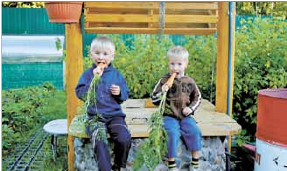
■ Витамины, свежий воздух и раздолье для детей и внуков дачников