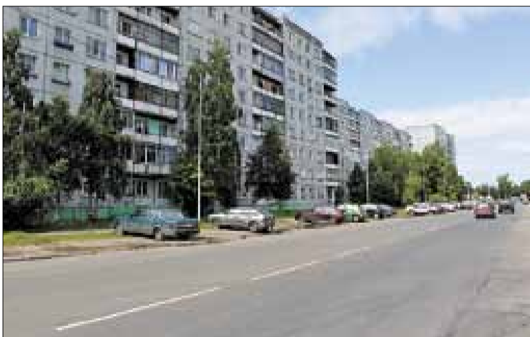
■ ул. Воронина.