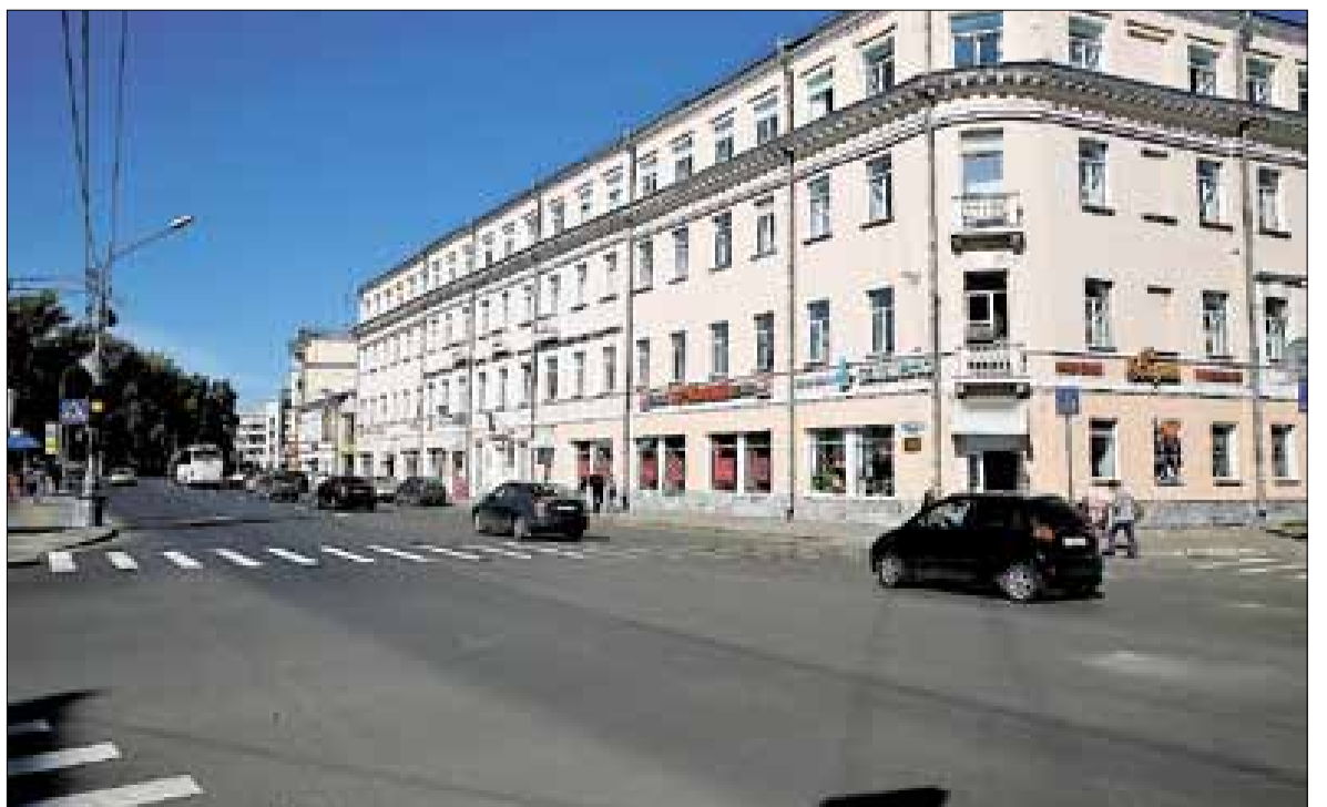
■ пр. Троицкий.