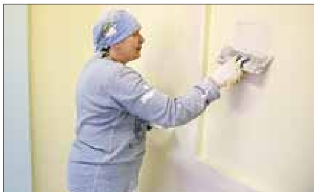
■ Чтобы 1 сентября дети пришли в обновленные классы и группы, там сейчас идет ремонт