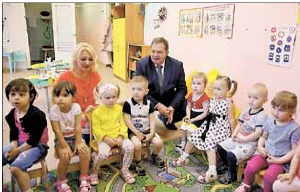
■ Детский сад «Радуга» к новому учебному году готов

Завершается подготовка к новому учебному году и в детском саду № 131 «Радуга»