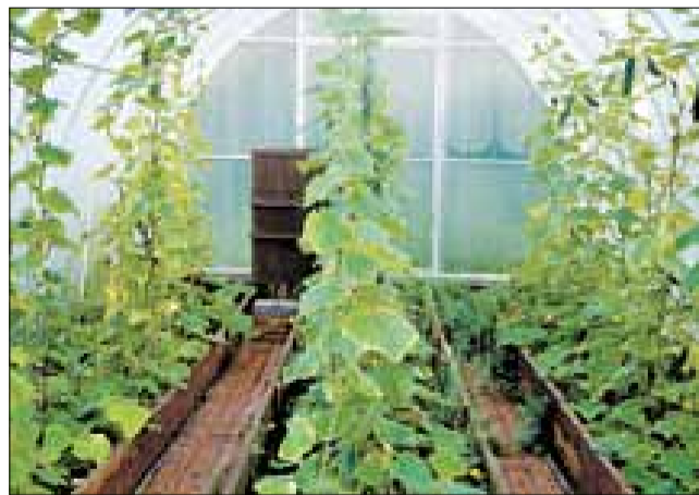
■ В теплице из поликарбоната огурцам теплее, урожай лучше