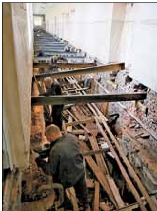
■ В школе № 22 заменили сваи и делают новые полы