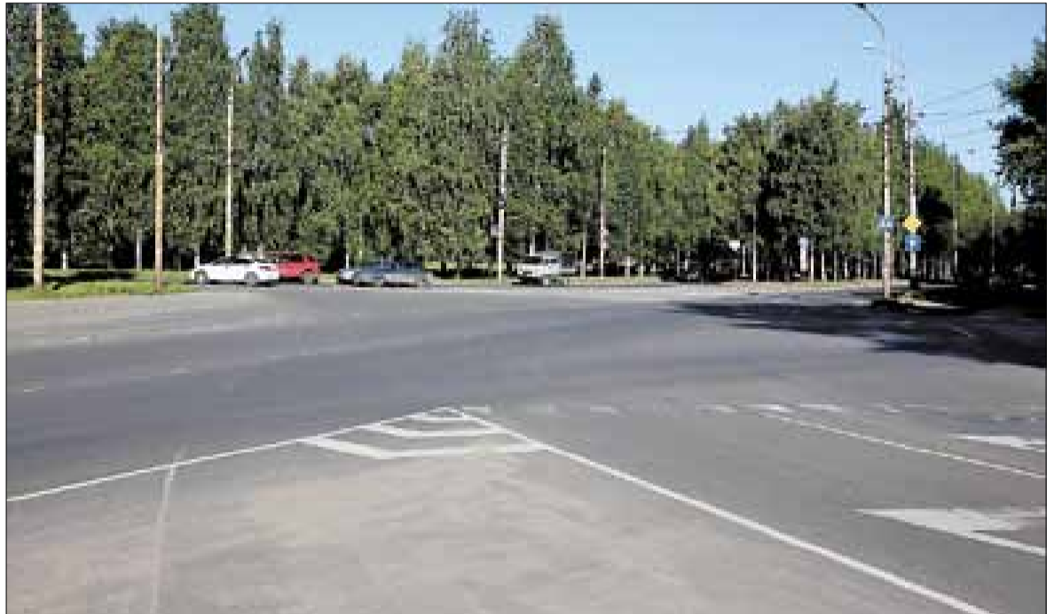
■ ул. Гагарина.

– Основные работы в рамках средств муниципального дорожного фонда выполнены. Но предстоит еще второй этап работ в рамках 100 миллионов рублей, объектов много. Самое главное – качество ремонта, сроки проведения работ и грамотная организация движения. Особое внимание обращают на Северодвинский мост, где и так в часы пик очень напряженное движение. Поэтому подрядчик обязан согласовать схему движения с ГИБДД и мэрией и обеспечить нормальные условия для проезда автотранспорта, – поставил задачу мэр Виктор Павленко.