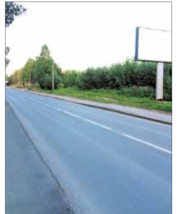
■ ул. 23-й Гвардейской Дивизии. ФОТО: ПРЕСС-СЛУЖБА МЭРИИ