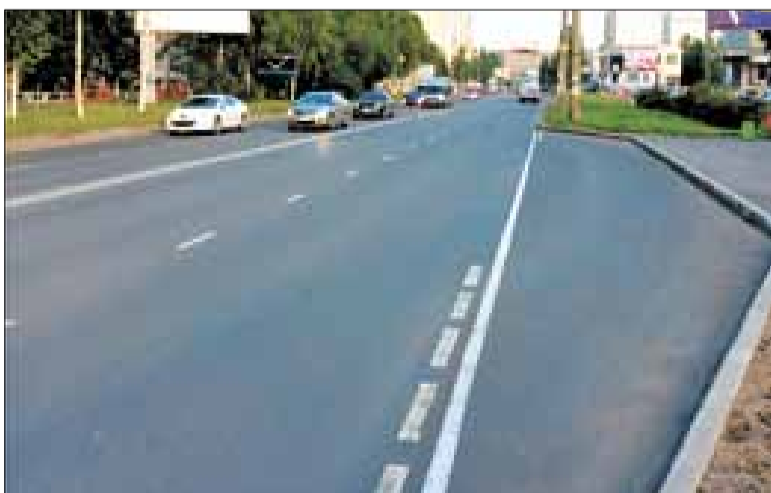
■ ул. Тимме.