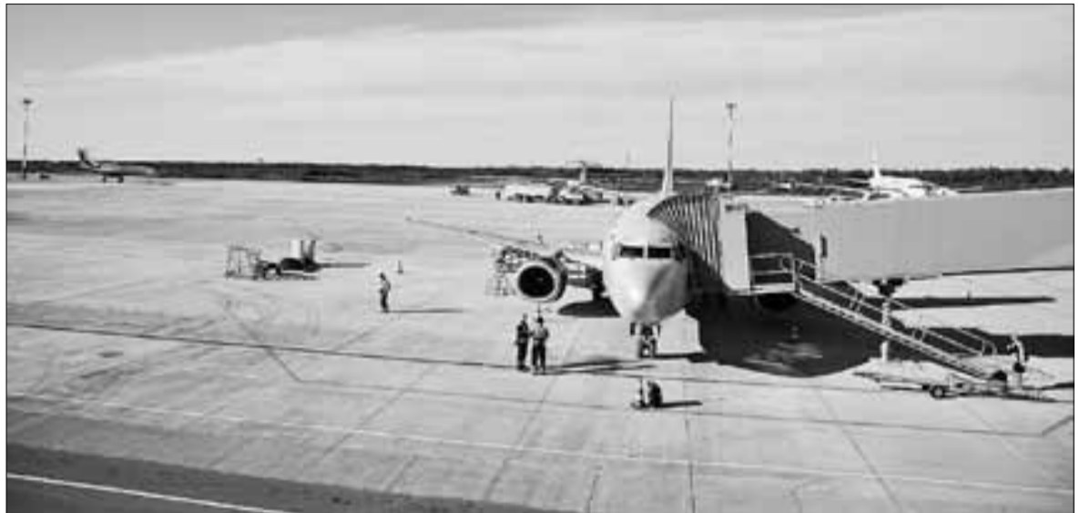
■ Строители обновили аэродромное покрытие и значительно расширили площадь перрона