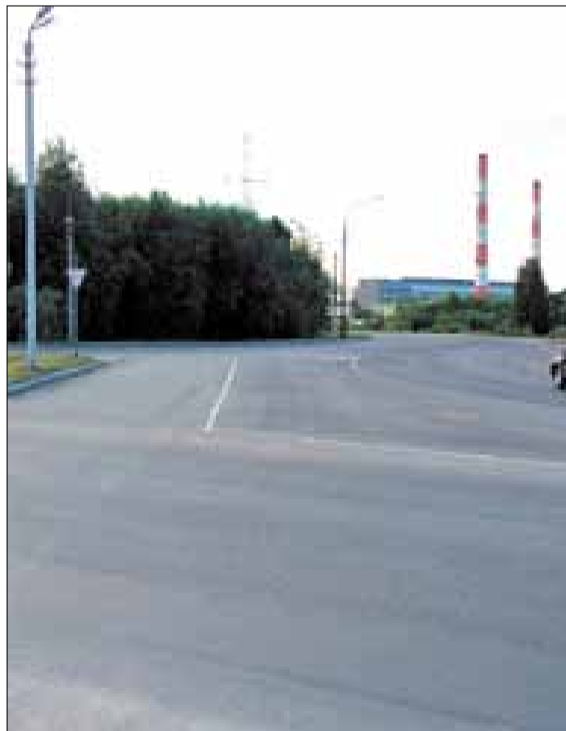
■ Окружное шоссе.